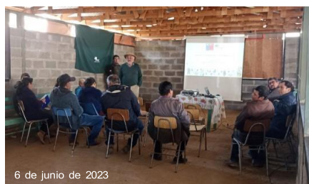
6 de junio de 2023

Nos reunimos en la oficina provincial de Illapel para retomar el trabajo del Plan de Manejo, luego lo alojamos en la RN Las Chinchillas y al día siguiente nos reunimos con los vecinos del Durazno. Trabajamos con un mapeo participativo.