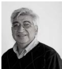
Presidente: Manuel Pinto