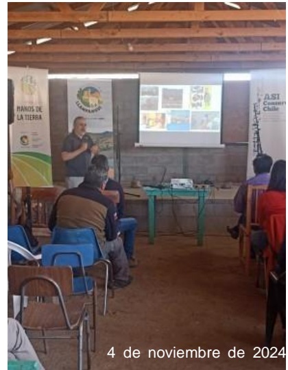
4 de noviembre de 2024

2024 - 2025.- Proyecto ACCIONA para mejorar la dieta y los cuidados Veterinarios de la población de guanacos del Centro